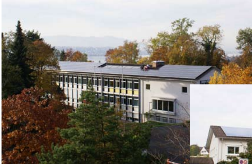
32.375 kWp PV Anlage Oberer Hitzberg 1