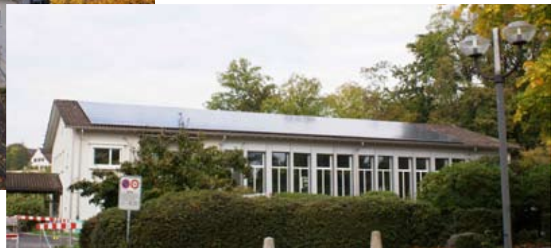
31.08 kWp PV Anlage Oberer Hitzberg 3

Die PV Anlage Oberer Hitzberg (OH) besteht aus 3 Teilanlagen: Auf der Turnhalle Oberer Hitzberg die 31.08 kWp Anlage Hitzberg 3, auf dem Schulhaus Oberer Hitzberg die Anlagen Hitzberg 1 mit einer Nennleistung von 32.375 kWp und Hitzberg 2 mit 10.915 kWp. Alle 3 Anlagen speisen den produzierten Solarstrom auf einen gemeinsamen Einspeisepunkt im Schulhaus Oberen Hitzberg ein. Auf dem Schulhaus Oberer Hitzberg ist zudem eine solarthermische Anlage installiert für die Warmwasser Aufbereitung.