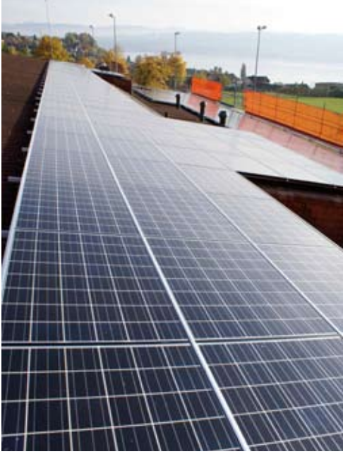
58.275 kWp PV Anlage Schrägdach Sporthalle Allmendli