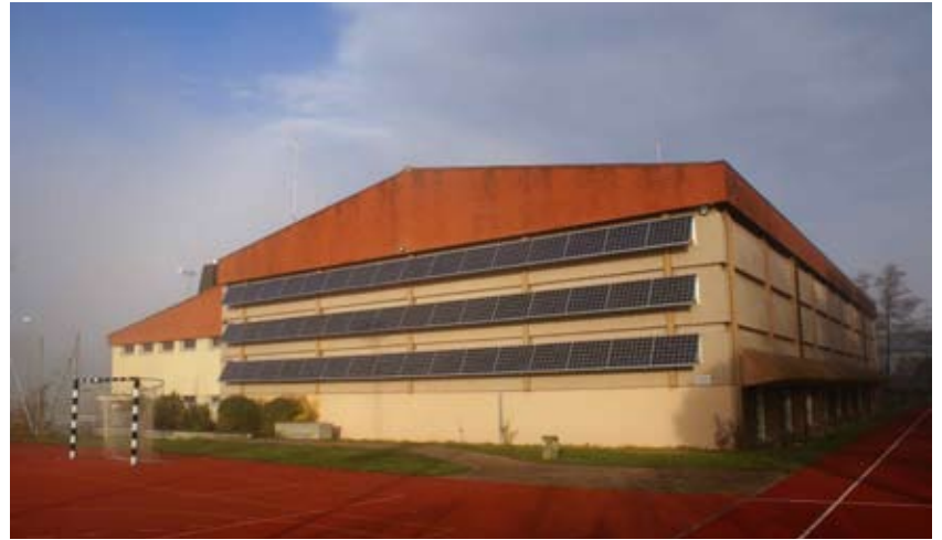
8.88 kWp PV Anlage Fassade Sporthalle Allmendli

Die PV Anlage Sporthalle Allmendli besteht aus der 58.275kWp Anlage auf dem Schrägdach der Sporthalle und der 8.88kWp Anlage an der Südfassade der Sporthalle. Beide Anlagen speisen den Strom direkt in die Trafostation bei der Zivilschutzanlage ein.